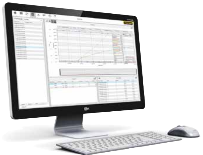
Program VCD do sterowania, wizualizacji i dokumentacji