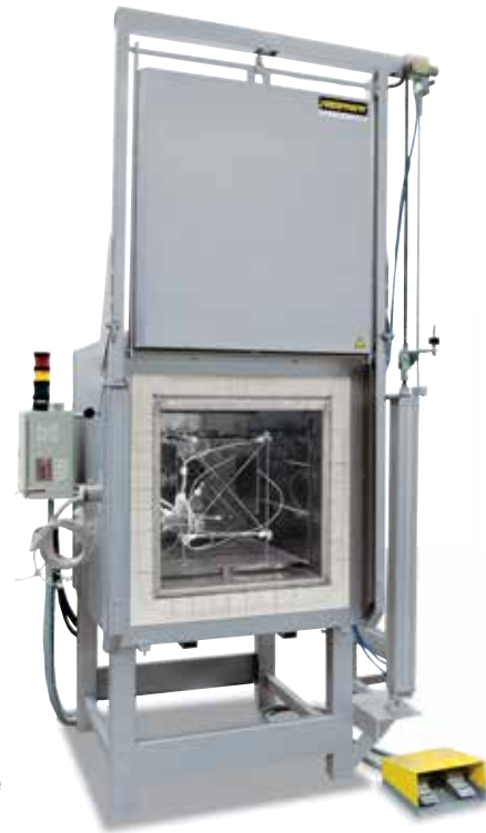
Stojak pomiarowy do wyznaczenia równomierności temperatury

W przypadku pieca standardowego zagwarantowana jest równomierność temperatury w +/- K bez wykonania pomiaru pieca. W ramach wyposażenia dodatkowego można zamówić usługę pomiaru równomierności temperatury przy określonej temperaturze zadanej w przestrzeni użytkowej według normy DIN 17052-1. W zależności od modelu pieca w piecu umieszcza się stojak odpowiadający wymiarom przestrzeni użytkowej. Na tym stojaku umieszcza się 11 termoelementów przymocowanych w określonych punktach pomiarowych. Pomiar rozdziału temperatury odbywa się przy zdefiniowanej przez klienta temperaturze zadanej po upływie wcześniej wyznaczonego czasu wygrzewania. Jeżeli to wymagane, można również skalibrować różne wartości temperatury zadanej lub określony zakres temperatury zadanej.